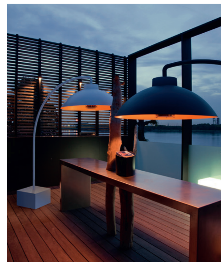
• Licht und Wärme in einem: Dome von Heatsail.

Es ist die Summe der kleinen Dinge, die das Ganze machen. Dem professionellen Blick des Chillout-Area-Teams entgeht nichts, was eventuell unstimmig sein könnte. Mit ihrer Expertise rund