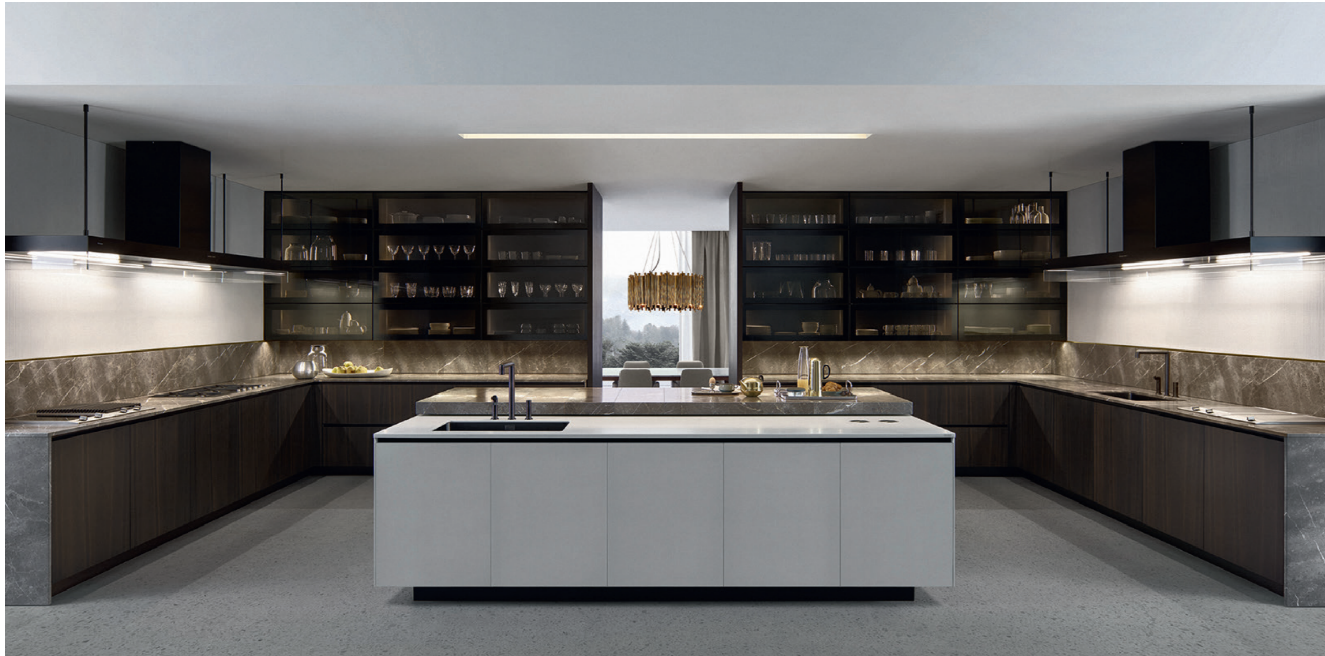
• Küche Alea von Poliform.