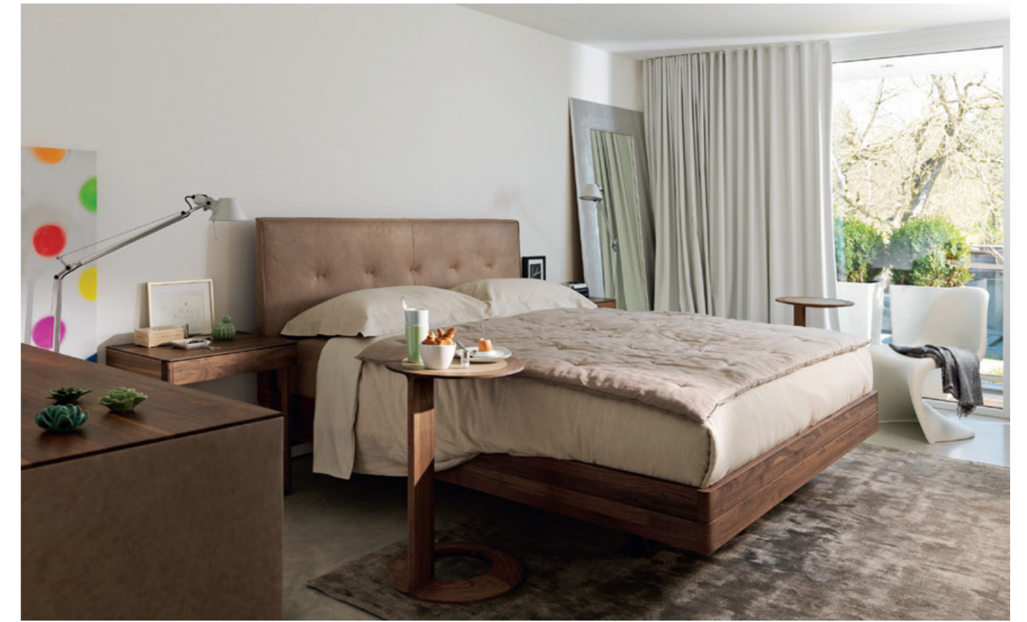
• Bett Float von Team 7.

„Wir setzen auf höchste Qualität und exklusive Markenvielfalt.“