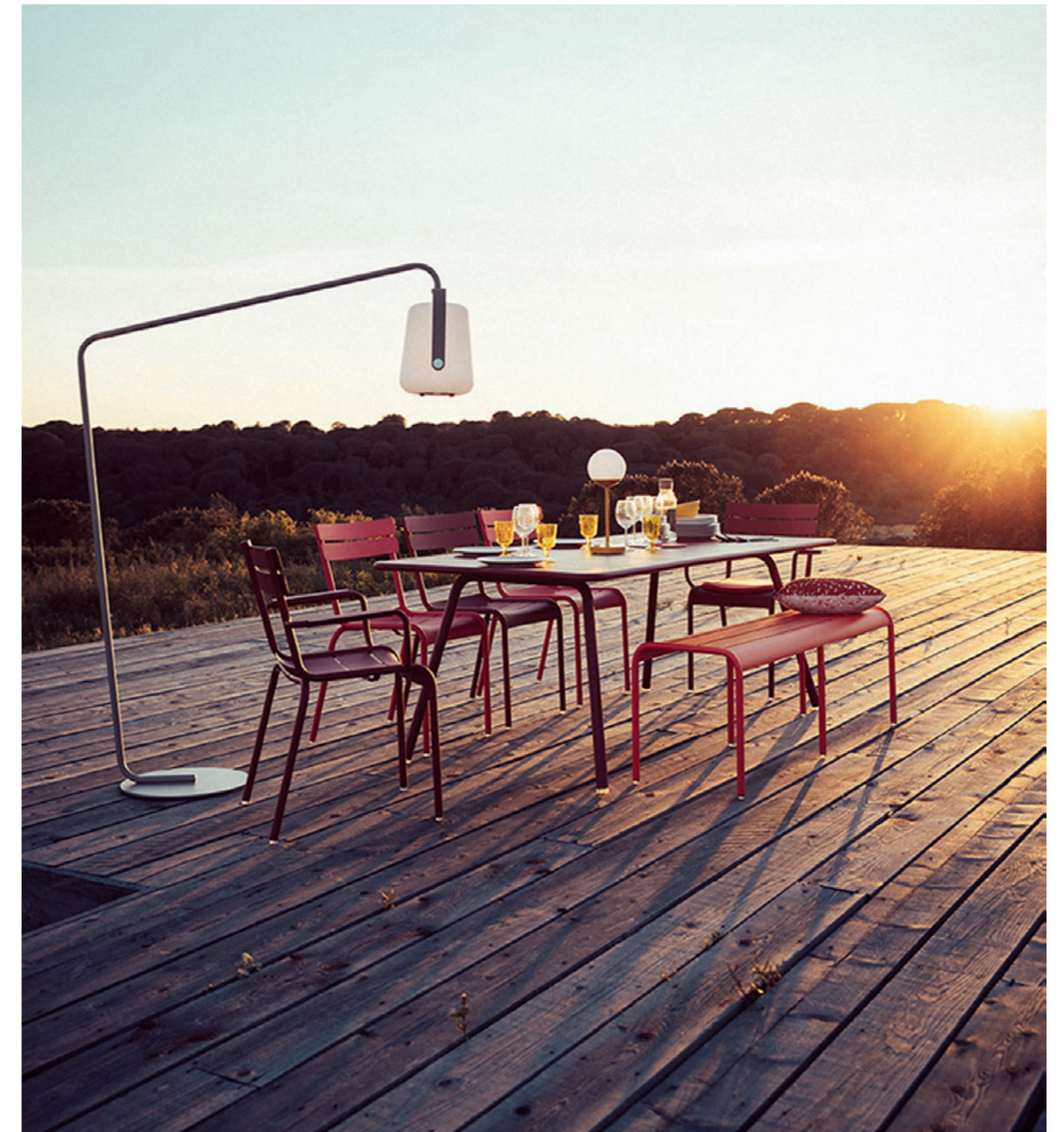
• An alles gedacht: Kollektion Luxembourg von Fermob.

Nur ein perfekt geplanter und gemütlicher Freiraum lädt zum genussvollen Verweilen ein. Um für eine Terrasse von Beginn gleich das Richtige zu entscheiden, empfiehlt es sich, die fachliche Be-