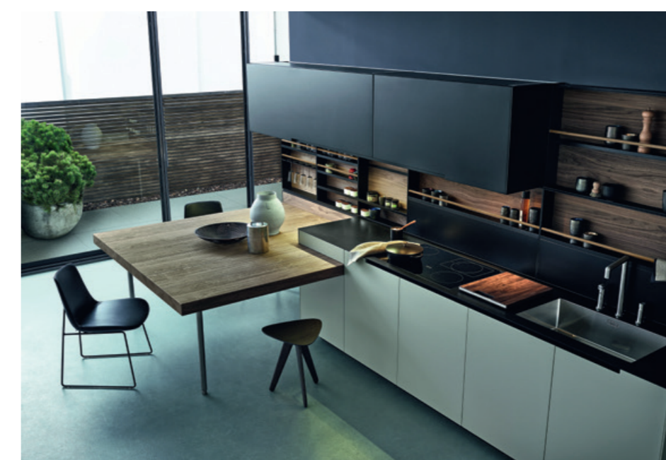
• Küche Phoenix von Poliform.