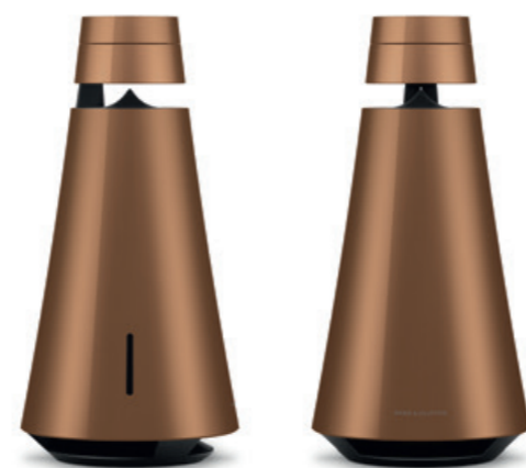
◀ Beosound 1

Wenn sich das Leben mit steigender Anzahl von Sonnenstunden immer mehr nach draußen verlagert, gehört zur exklusiven Ausstattung des Outdoor-Wohnzimmers auch der richtige Sound. Bang & Olufsen hat diesen starken Trend in sein Portfolio aufgenommen und bietet mit mobilen, handlichen Lautsprechern das perfekte Klangerlebnis auch auf der Terrasse. Diese lassen sich wie treue Begleiter kabellos an den Ort, an dem man verweilen will, mitnehmen und über Bluetooth mit sämtlichen anderen Geräten verbinden. Der kompakte BeoLit 17 aus Aluminium spielt die Wunschplaylist 24 Stunden und birgt mit seinem Tragriemen aus Leder einen Hauch von Nostalgie in sich. Der futuristische, dreibeinige Beo Play A9